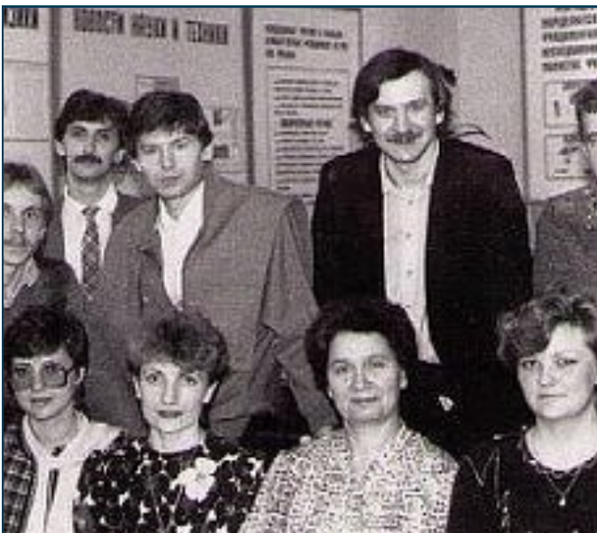
Встреча через 10 лет после выпуска.