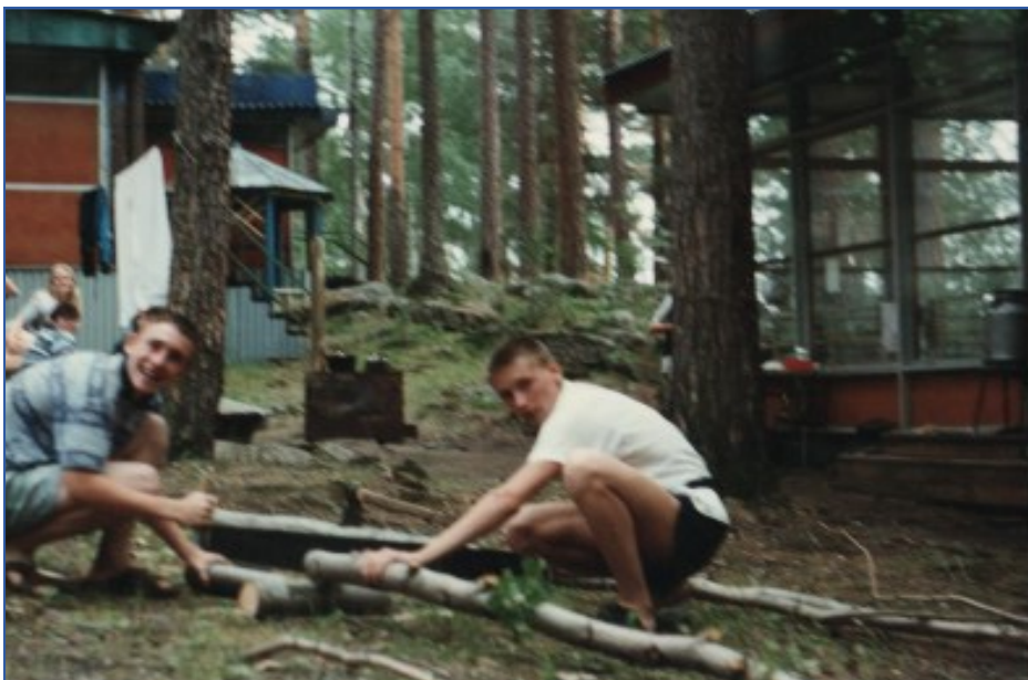
«Старшаки» помогли рубить и пилить дрова.

Такие задания, как поставить палатку, зажечь костер, у кого быстрее закипит в котелке вода – это все они знали, этим мы занимались. У нас каждый год два дня было туристических. Старшаки учили, как костер при дожде разводить, как укрепить палатку, чтобы дождем не смылась, и так далее.