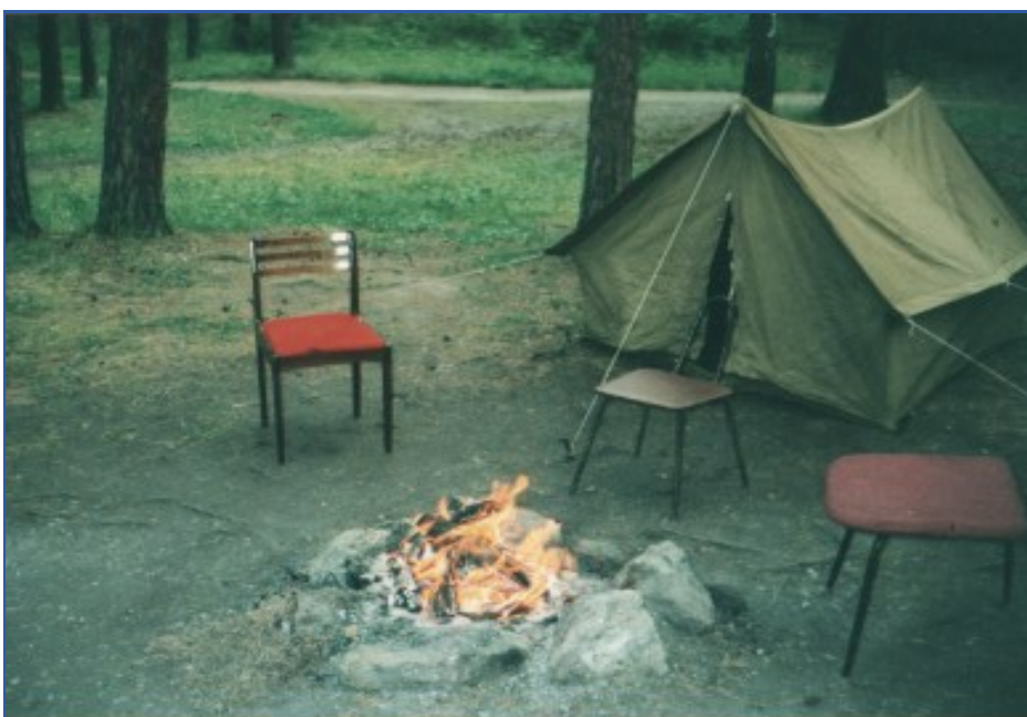
«Традицией стала игра «Последний герой», когда внезапно закрывали корпус, отрядам выдавали палатку и полбуханки хлеба. Остальное «зарабатывалось» в конкурсах. А конкурсы сложные были...»

Но были другие конкурсы. Например, принесли в ведре воду из болота, она уже гнилая, а туда еще посадили жабу, настолько неприятную, потому что какая-то пупырчатая, маленьких рыбок, всякую нечисть. На дне лежал киндерсюрприз с ключиком.