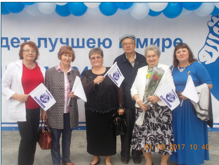
Выпускники школы на торжественной линейке, посвященной 55-летию родной школы 94

Те, кто помнит своих одноклассников, для кого школьная дружба священна, собираются вместе, приглашают сво-