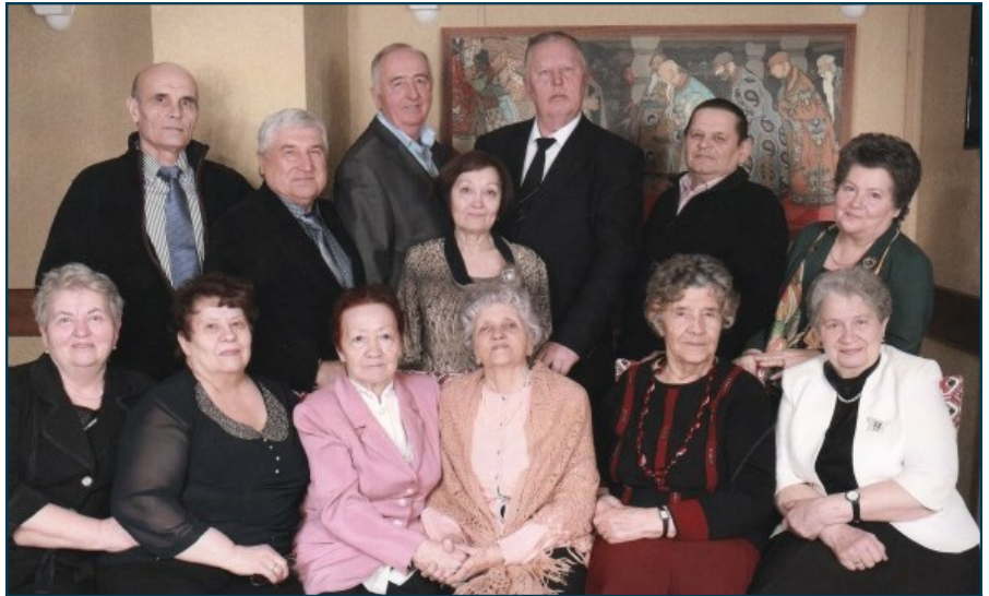
Выпускники 1965 года

Я желаю творческих успехов всем, кто работает, учится в стенах родной моей школы! Желаю счастья всем нашим выпускникам!