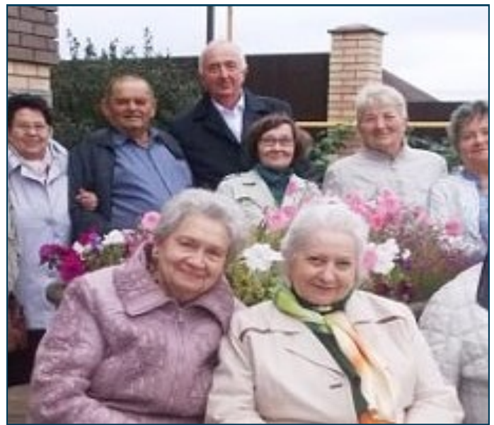
Выпуск 1965 года. Через 50 лет